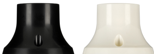
141124 Lamphouder E27 TP Opbouw Recht Zwart