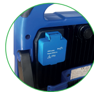
2x USB 5V DC