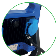
AC socket / Stopcontact / Prise courant / Steckdose