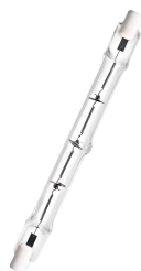
H117042300 R7s 8X117 42V 300W