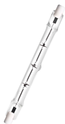
H117042400 R7s 8X117 42V 400W