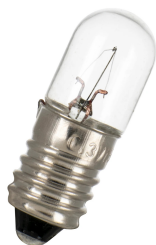
E28012300 E10 T10X28 12V 300mA 3.6W C-2V