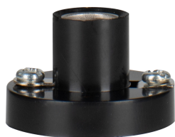
141135 Douille E10 TP Noir